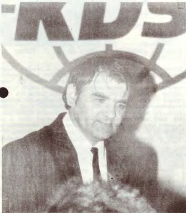
Zasedání politické rady KDS se zúčastnil ministr životního prostředí České republiky Ivan Dejmek (bližší na 2. straně)