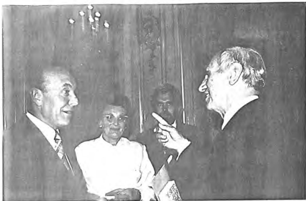
Zástupci Rady národnostní skupiny u presidenta republiky.