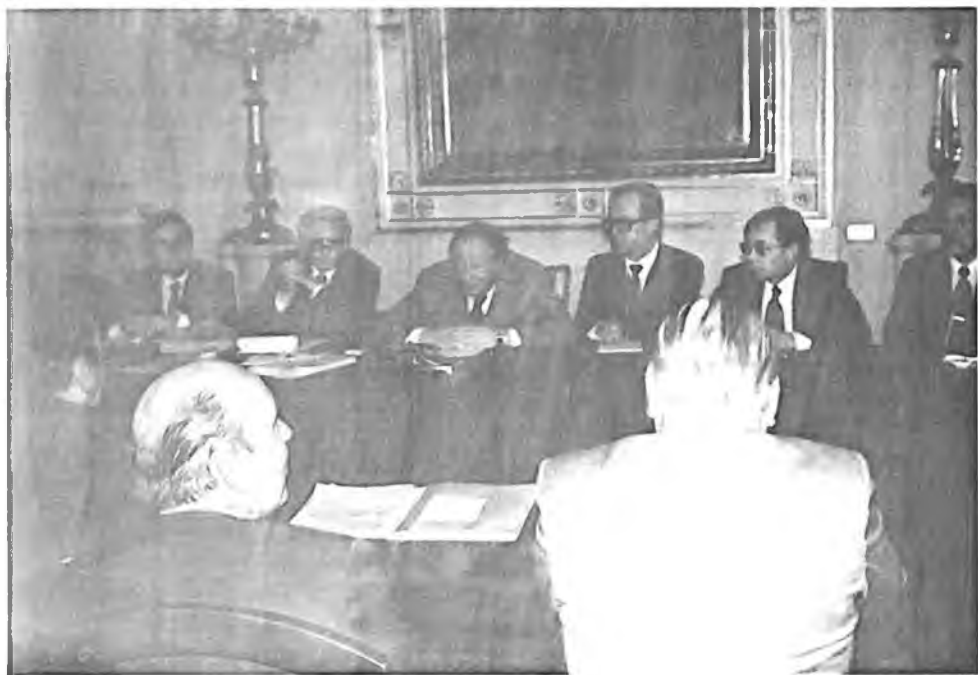
Naši zástupci při jednánís kancléřem dr.B.Kreiským