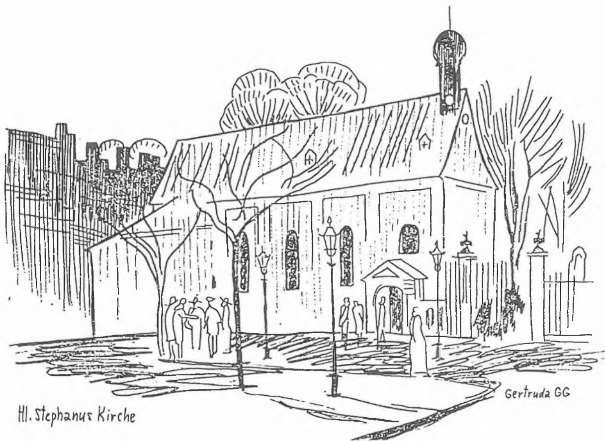
Hl. Stephanus Kirche