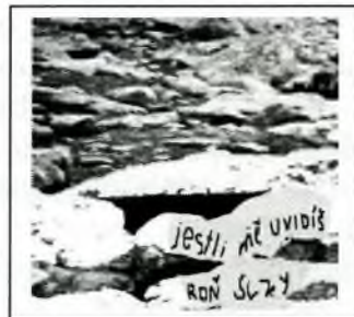
"Hladové kameny" Řeka Labe z roku 1616

Republika si začíná hlídat zvířata která tam nepatří a mnohá jména nás překvapí, jako na př. želva a mýval, různé druhy veverek atd. Majitelé těchto zvířat je musí registrovat a nesmí je vypouštět do volné přírody. Tato invazivní zvířata se nesmí do republiky dovážet, prodávat a jejich rozmnožování je zakázáno, jenomže ne všechna zvířata potřebují oba sexy. Tak na příklad "rak mramorovaný" nepotřebuje samce, všechno to jsou samice. V akvariu stačí jedna samice, aby vyprodukovala mláďata.