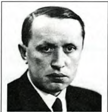
Karel Čapek, autor dnešní povídky

A dnes se dozvíme o Bratru Františkovi, v povídce "Bratr František" z knihy Apokryfů, od Karla Čapka: