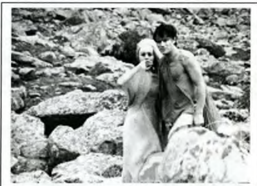
O věčném milování Radúze a Mahuleny

Je to pohádka jak se patří, dvě knížectví jsou proti sobě, zásluhou zlé, žárlivé královny Runy , Princ Radúz z Madury zabloudí do země Runy, té se podaří ho najít, uvrhne ho do kobky a později ho dá přikovat ke skále. Když Radúze odvádějí, vidí Mahulenu, která pláče nad jeho osudem. Pastýř najde klíče k okovům Radúze, dá je Mahuleně, a ta Radúze osvobodí. Do toho přikvačí Runa, prokleje dceru i Radúze, že jakmile jiná žena políbí Radúze, zapomene na Mahulenu, nezná ji. Radúz s Mahulenou kvapí do jeho domova, tam znějí smuteční hrany, zemřel otec Král. Radúz kvapí ke své