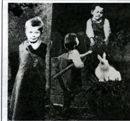
Děti v ústavu krmí králíky