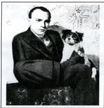
Moje psí přítelkyně