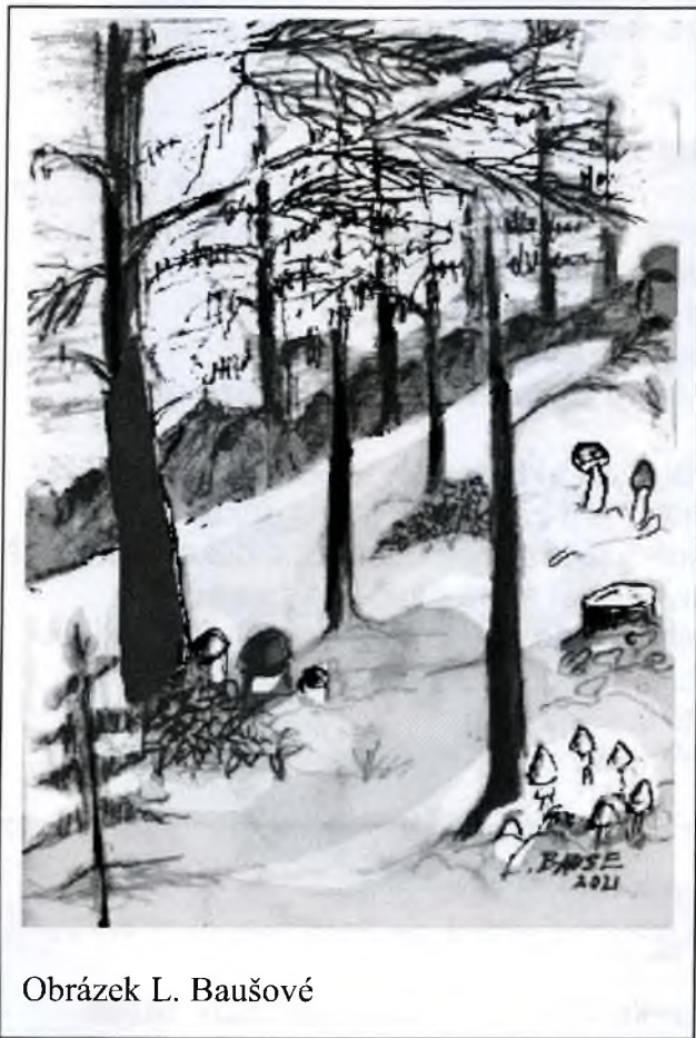
Obrázek L. Baušové

V tramvajích, metru a autobusech projíždějících kolem vlakových a autobusových nádraží uvidíte na podzim neobvyklou skupinu cestujících. Zejména v neděli večer se nelze vyhnout divoké ukoptěné tlupě, která se vrhne do dopravních prostředků, ověšená ruksaky, kufry, košíky a taškami. Jsou to houbaři vracející se domů s weekendovým úlovkem