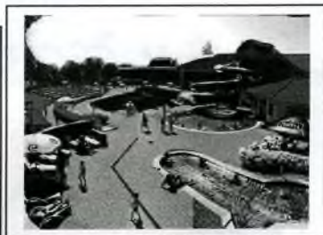
Aquapark - hot springs