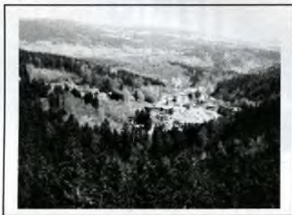
Lázně jsou obklopeny lesy