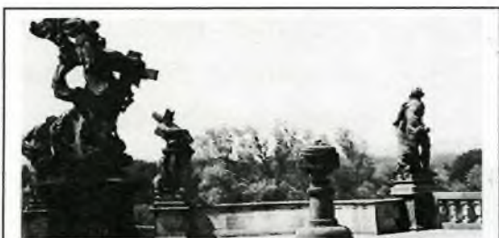
Skupina soch před zámkem blízko Kaple

Největší pozornost však neustále zaujímají Braunovy sochy na pozemku zámku a v blízkém okolí.