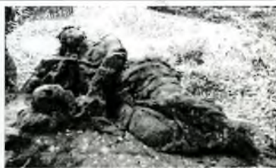
Kajícnice Máří Magdalena Braunův betlém Nový Les