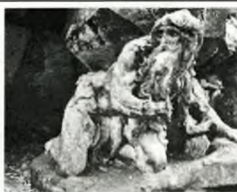
Poustevník Garinus, se jako pokání musel stále plazit jako zvíře. Oblast pousteven