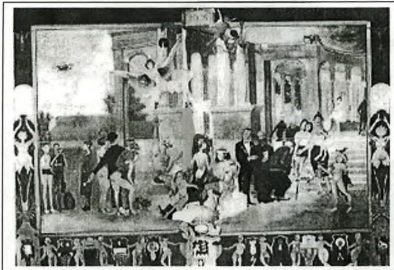
( opona v Semaforu)

Opona nám připomene oponu v Národním divadle. Nejsme si jisti, zda je to kompliment panu Hynaisovi nebo tak trochu moderní žert.