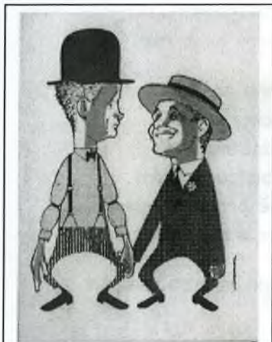
J. Suchý a J. Šlitr

zábradlí”, kde byl uveden muzikál J. Suchého “Kdyby tisíc klarinetů” a představení mělo ohromný úspěch.