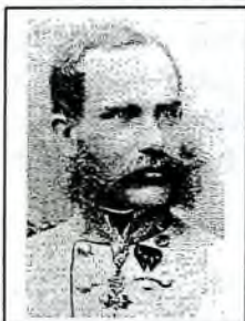
František Josef I