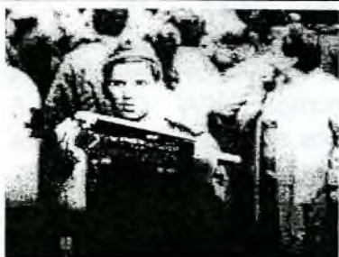
Ruský voják s protitankovou zbraní