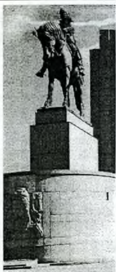
Památník národního osvobození v Praze na Vítkově

Už ve 20tých letech 20 století se začla na Vítkově stavět budova Památníku národního osvobození, kde se měla propojit husitská a legionářská tradice. Některé místnosti byly určeny pro těla zemřelých legionářů a významných Čechů