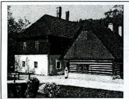
Staré bělidlo v Babiččině údolí

Slavnost se přesto konala a zúčastnilo se jí 20 tisíc lidí , mezi nimi sokolové, legionáři, skauti, turistické spolky, tisk, pěvecké sbory, dokonce i alegorické vozy. Alois Jirásek zaklepal na základní kámen a naděje byly, že pomník bude odhalen ve dnech výročí smrti B. Němcové.