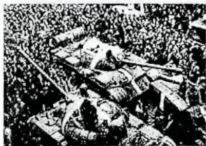
Tanky uprosřed davů lidí v Praze

Náš DD vychází 21.8. 2017. Za rok tomu bude 50 let co vojska Varšavské smlouvy napadla Čsl. republiku a tím drasticky změnila osud nás všech co zde jsme. Vojska poslaly tyto země: SSSR, Polsko, Maďarsko, Bulharsko. Vojsko NDR bylo připraveno, ale hranice republiky nepřekročilo. Invaze se nezúčastnilo Rumunsko a Albanie, jež po tomto útoku vystoupila z Varšavské smlouvy. Jugoslavie nabídla pomoc republice.