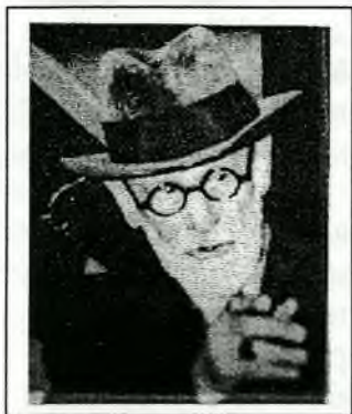
S.Freud v roce 1938.

Freud detailně rozpracoval tyto teorie v knihách "Ego a Id". "Id" je podvědomí, "Ego" je vědomé JÁ a "Superego" je svědomí, cosi jako "nadjá". Lidskou psychiku viděl jako energetickou soustavu, jejíž dynamika vyvěrá z konfliktu mezi vědomými a nevědomými tendencemi. Podvědomí může být tvůrčí i destruktivní.