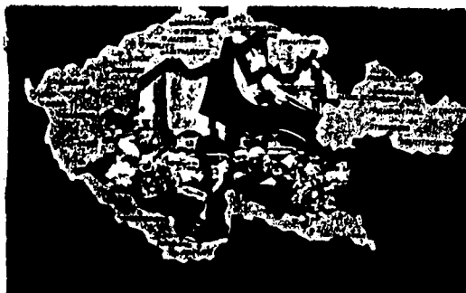
WIR DANKEN UNSERM FÜHRER