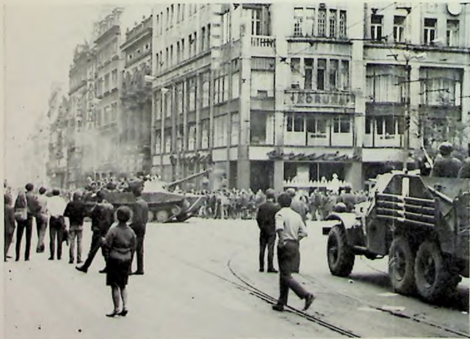
Praha — Můstek, který tak rádi fotografovali zahraniční turisté. Nejrušnější a nejveselejší místo Prahy. Jednadvacátého srpna 1968 se tu pořizovaly dokumentární fotografie sovětské hanby.

Dva dni před prvním výročím invaze byli do Prahy povoláni komunističtí aktivisté z celých Čech a Moravy, aby byli na poslední chvíli instruováni, jak se zachovat, kdyby v osudný den došlo k nepokojům. Husák a Svoboda měli v rozhlase a televizi projevy, které byly natočeny a připraveny k vysílání v předvečer okupace. Dělníci večerních a nočních směn budou mít umožněno opustit stroje a projevy vyslechnout. Praha je v těchto dnech studená a beze slunce a lidé na ulicích jsou klidní a smutní. Rusové v městě nejsou, čekají v okolí. Těch několik desítek sovětských turistů, kteří přijeli do Prahy, si nikdo nevšímá. Jsou-li to provokatéři, nemají žádnou naději. Den před výročím použila pražská policie slzotvorný plyn a obušky proti několika stům tichých demonstrantů na Václavském náměstí. Bylo zatčeno dvacet lidí a okolostojící diváci volali na policii "Gestapo". Provokace stalinistů má být zahájena v noci na 21. srpna. Skončit má dosazením Aloise Indry do funkce prvního tajemníka československé komunistické strany.