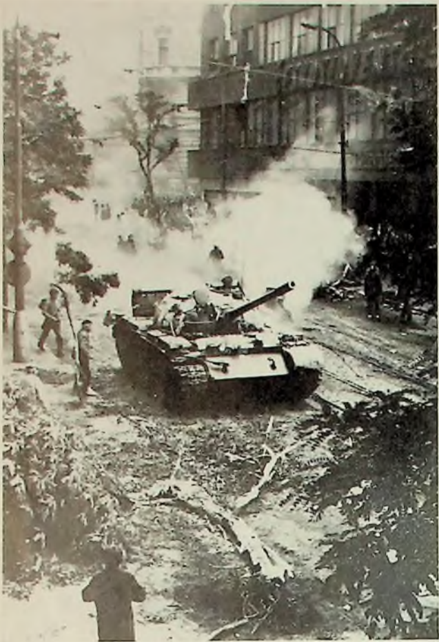
Tanky se vrhaly proti československému rozhlasu; lidé se holýma rukama vrhali proti tankům.