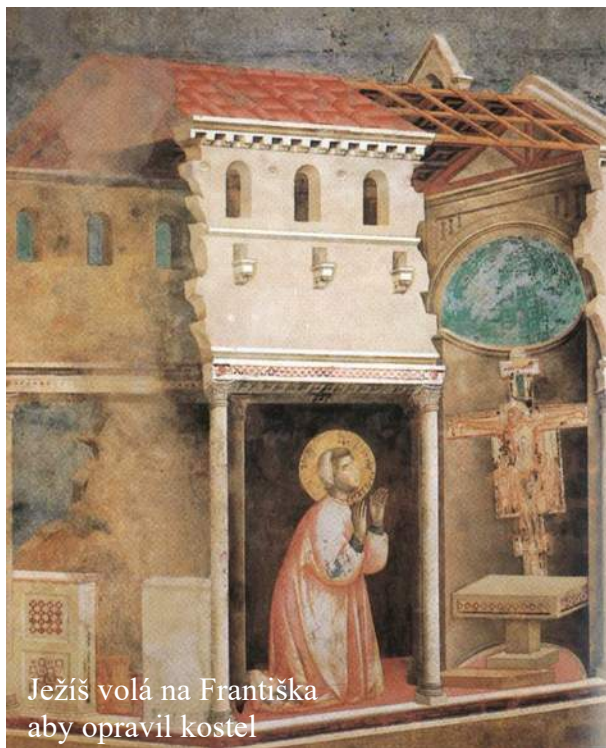
Ježiš volá na Františka aby opravil kostel

Krátko na to sa František zriekol bohatstva aj svojho dedičstva a začal žiť najprv ako pustovník. Pán si ho však viedol k apoštolskému životu a oslovil ho veršami z Matúšovho evanjelia (Mt, 10): „Chod'te a hlásajte: „Priblížilo sa nebeské kráľovstvo.“ Chorých uzdravujte, mŕtvych krieste; malomocných očisťujte, zlých duchov vyhánajte. Zadarmo ste dostali, zadarmo dávajte. Neberte si do opaskov ani zlato ani striebro ani peniaze; ani kapsu na cestu si neberte ani dvojce šiat ani obuv ani palicu, lebo robotník si zaslúži svoj pokrm.“ František si tieto slová vzal k srdcu - nesporne vďaka pôsobeniu Ducha Svätého, a začal pôsobiť ako potulný kazateľ.