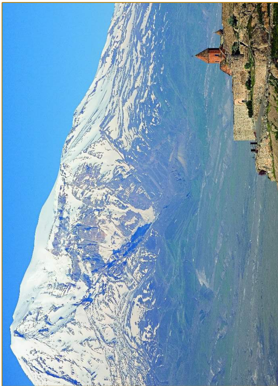
Papež František navštívil Klášter Khosrovi - Arménie, v pozadí hora Ararat