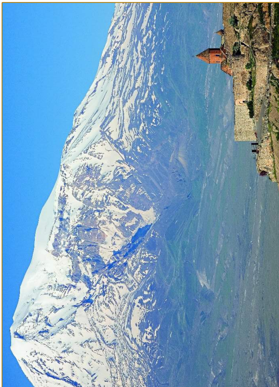
Papež František navštívil Klášter Khosrov - Arménie, v pozadí hora Ararat