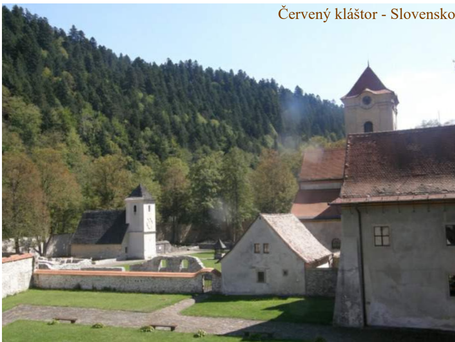
Červený kláštor - Slovensko

Dnes má kartuziánsky rád 20 mužských a 5 ženských kláštorov, v ktorých žije 370 mníchov a 75 mnišok. Odporučil by som navštíviť múzeum na Červenom kláštore v slovenských Pieninách, kde môžete navštíviť expozíciu bývalého kartuziánskeho kláštora. Takisto sa môžete pokochať pohľadom na jediný kartuziánsky kláštor v USA, ktorým je kláštor Premenenia Pána pod horou Equinox na juhu štátu Vermont, dnu do kláštora ani do jeho bezprostrednej blízkosti sa však nedostanete. Keď sa však vyberiete na vrchol Equinoxu je na tento kláštor pekný pohľad a môžete si tiež kúpiť niektoré suveníry vyrobené mníchmi v obchode pod Equinoxom. Taktiež by som odporučil pozrieť si unikátny nemecký dokument „ Into great silence “, ktorý bol natočený vo Veľkej Kartúze. Autor dokumentu čakal na povolenie natáčať v kláštore celých 16 rokov.