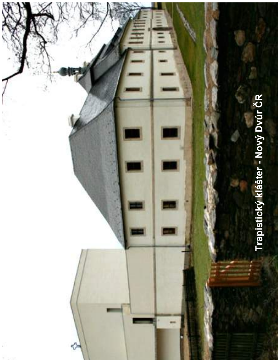
Trapistický klášter - Nový Dvůr ČR