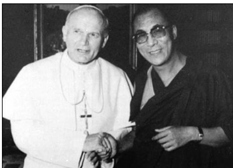
Sv. Jan Pavel II. s Dalajlámou

Brazilský teolog Leonard Boff kladl otázky tibetskému Dalajlámovi. Trochu ironická byla otázka hned na úvod: