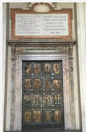
Svatá brána v bazilice sv. Petra - Řím

Následně jsme měli schůzi kněží, kteří mají na starosti komunitu