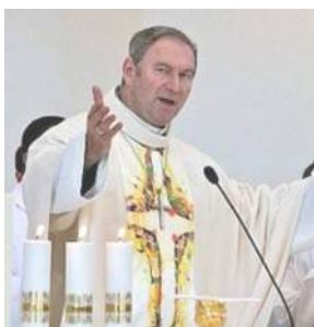
odvolaný arcibiskup Róbert Bezák

Rozhovor s P. Tomášem Halíkem o případu odvolaného arcibiskupa Róberta Bezáka. Trnavský arcibiskup Róbert Bezák byl za ne zcela jasných okolností odvolán 2. července 2012.