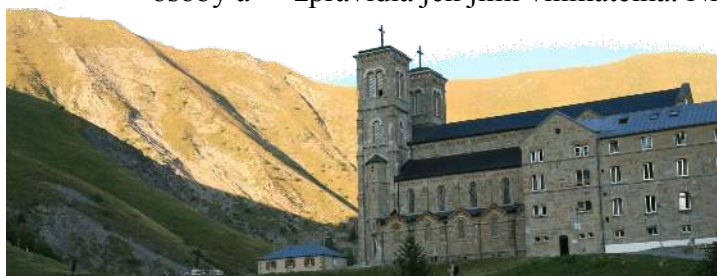
La Salette Francie

vazují. Boží zjevení závazné pro všechny bylo uzavřeno v apoštolské době.