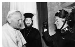
Jan Pavel II. a Gen. Eva Burrows - Edinburgh 1982

20. března - zemřela Gen. Eva Burrows, bývalá velitelka Armády spásy, kterou vedla v letech 1986 - 1993. Zemřela v Austrálii ve věku 86 let.