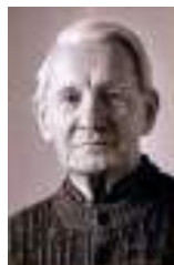
Mons. Václav Dvořák

Zpracováno podle knihy: Václav Dvořák, Čím to je, že jste tak klidný? Vydalo Karmelitánské nakladatelství převzato z www.vira.cz