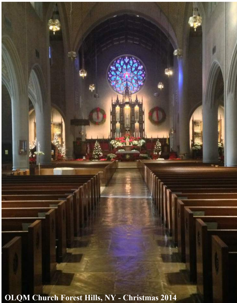
OLQM Church Forest Hills, NY - Christmas 2014