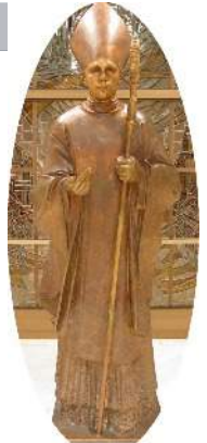
Sv. Jan Nepomuk Neumann v české kapli ve WDC

Kardinál Rigali zakončil svou slavnostní homilii slovy: " 'Dobrý Bože, učň mě svatým! Kéž nás svědectví a přímiluva sv. Jana Neumanna uvádí hlouběji do života svatosti! "