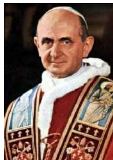
Sv. Jan XXIII.