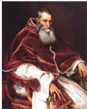
Papež Pavel III. *1468 + 1549