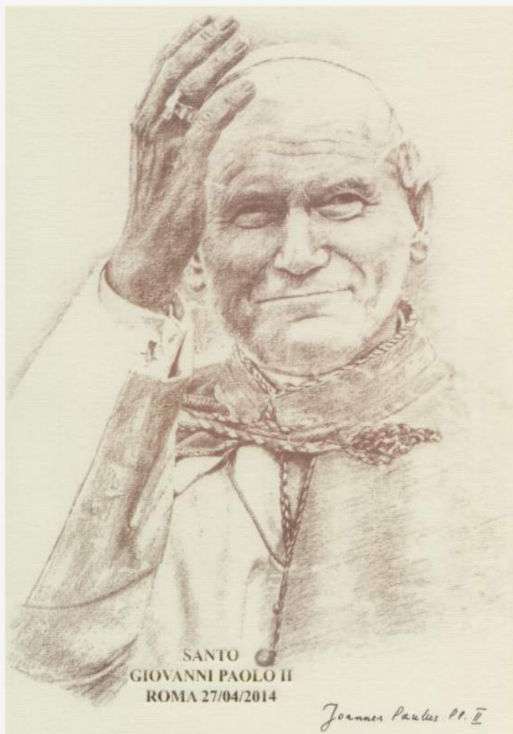
SANTO GIOVANNI PAOLO II ROMA 27/04/2014