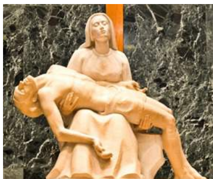
MOTHER OF SORROWS - PRAY FOR US PIETA SEDEMBOLESTNEJ PANNY MÁRIE V SLOVENSKEJ KAPLNKE NÁRODNEJ BAZILIKY NEPOŠKVRNENÉHO POČATIA VO WASHINGTON, D.C.

Každý mesiac tohto mariánskeho roka 2014 má svoju osobitnú tému, ktorej sa budeme postupne venovať v rámci niekoľkomesačnej prípravy, ktorá vyvrcholí púťou na Slávnosť Sedembolestnej Panny Márie do Národnej Baziliky Neпоškvrneného počatia vo Washington, D.C., kde bude slávnostná sv. omša