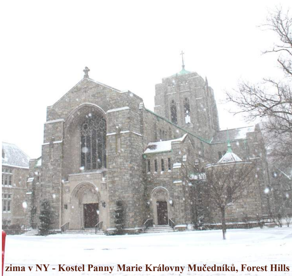
zima v NY - Kostel Panny Marie Královny Mučedníků, Forest Hills