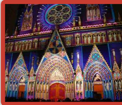
Slavnostně osvětlená katedrála sv. Jana v Lyonu

Dalším rozhodnutím procedury papeže (Viz.Zvon 3/2013)