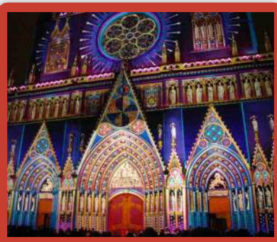
Slavnostně osvětlená katedrála sv. Jana v Lyonu

Dalším rozhodnutím procedury papeže (Viz.Zvon 3/2013)