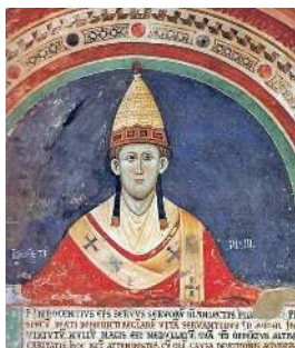
Papež Inocenc III. * 1160 + 16. července 1216

Na závěr koncil vybízí křesťany k osvobození Svaté země od Muslimů.