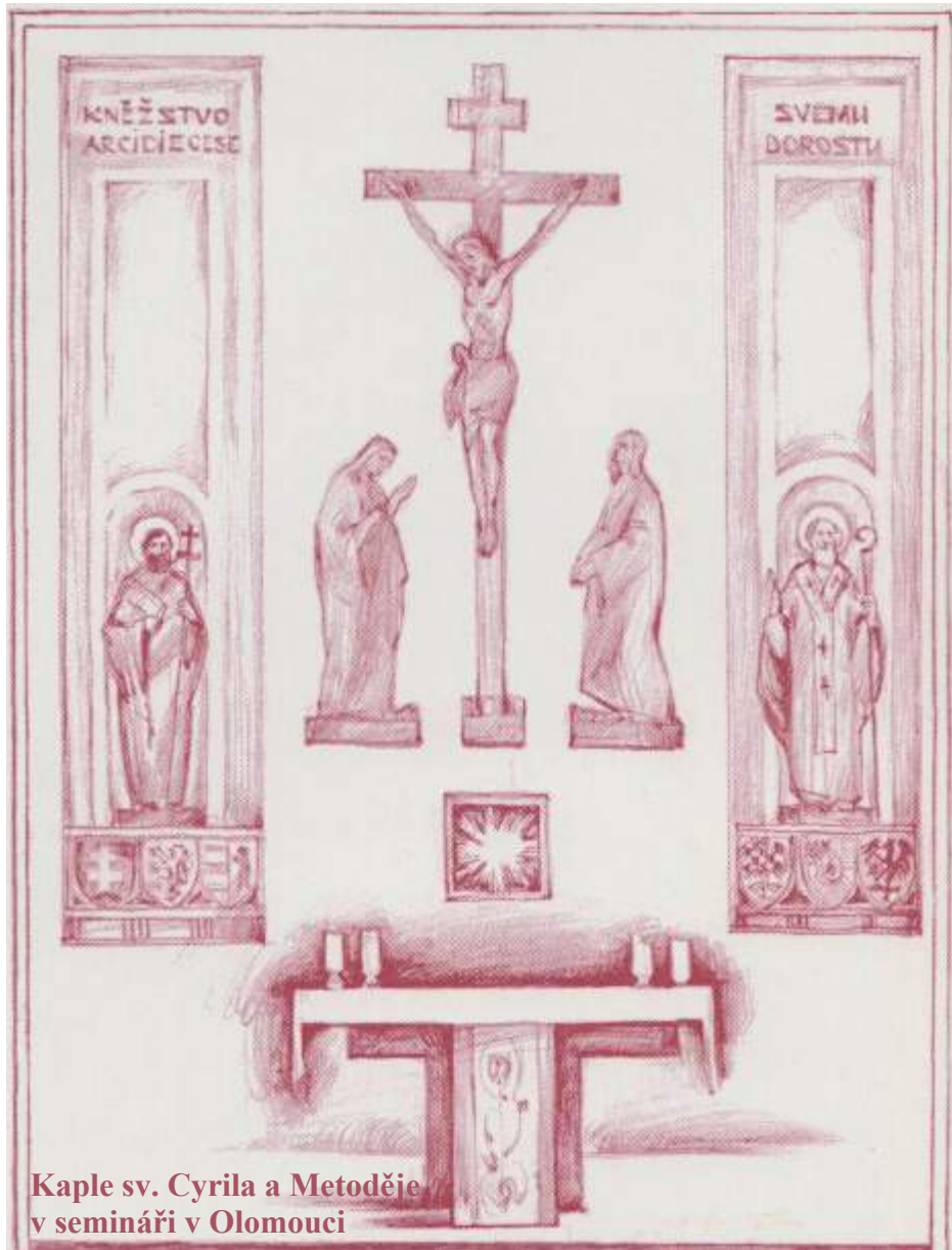
Kaple sv. Cyrila a Metoděje v semináři v Olomouci