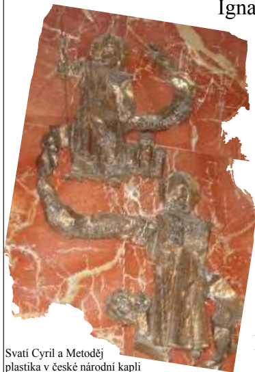
Svatí Cyril a Metoděj plastika v české národní kapli Panny Marie Hostýnské ve WDC

Konstantinopolský patriarcha Fotius byl ten, který spolu s císařem Michaelem III. na požadavek knížete Rostislava poslal sv. Cyrila a Metoděje na Velkou Moravu. Naši věrozvěstové přišli na naše území v roce 863.