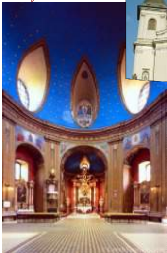
Panna Mária Bolestná Šaštín Patronka Slovenska