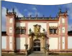
Panna Maria Svatohorská Příbram