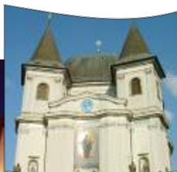
Panna Maria Hostýnská