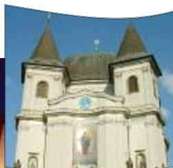
Panna Maria Hostýňská