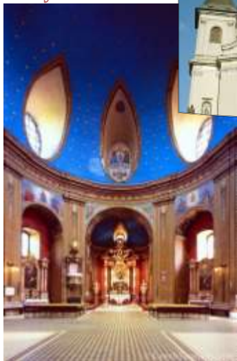
Panna Mária Bolesná Šaštín Patronka Slovenska