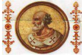
Papež Vigilius 537 - 555

Monofyzitizmu - Ježíš Kristus má jenom jednu - Boží přirozenost.