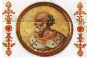
Papež Vigilius 537 - 555

Monofyzitizmu - Ježíš Kristus má jenom jednu - Boží přirozenost.