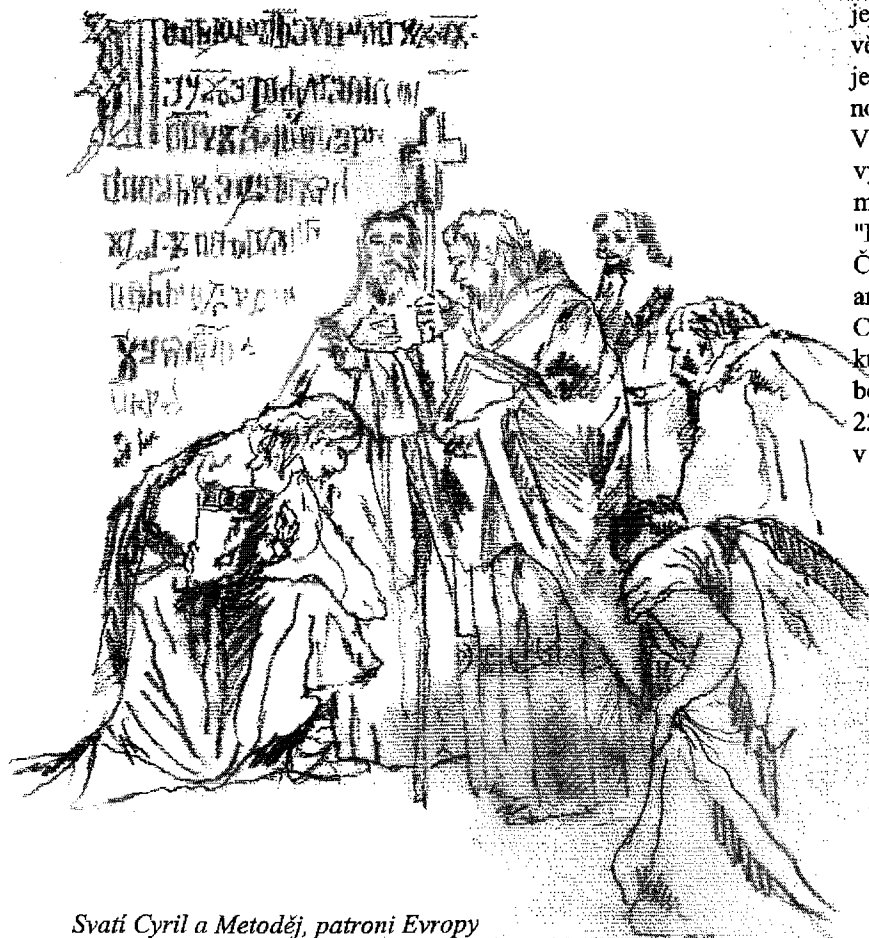
Svatí Cyril a Metoděj, patroni Evropy

Začínají nám letní měsíce a s tím také dovolené. Chystám se na velkou cestu na Západ. Rád bych se svými přáteli navštívil velké národní parky. Chceme cestovat asi tři týdny. Proto také toto číslo je dvojitější, další vydání bude až v srpnu.