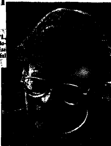
První ostravský biskup František Lobkowicz.

Požadavek na zřízení opavské diecéze vznesl již papež Pius VI. když v prosinci 1777 pověřil na žádost císařovny Marie Terezie olomoucké biskupství na arcibiskupství. Vedle nově zřízené diecéze brněnské mělo být druhým podřízeným též olomoucké arcidiecézi právě opavské biskupství.