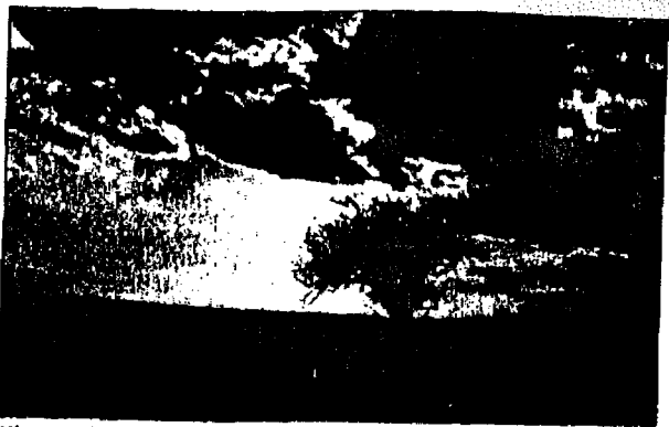
Hle, už tři léta přicházím hledat ovoce, a nic nenacházím.