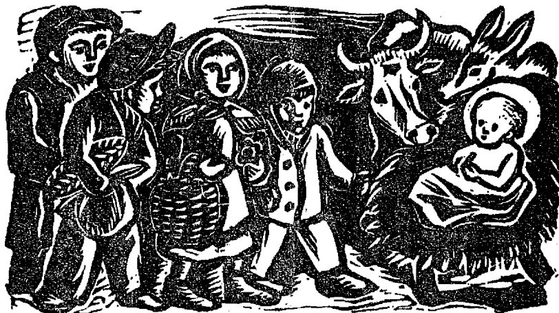
KOLEDNICI Z HORÁČKA

PODPORUJME NAŠE PODNIKY - NAŠE OBCHODNÍKY - NAŠE ŽIVNOSTNÍKY