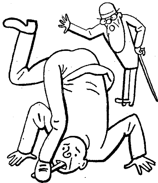
Šlape si na jazyk