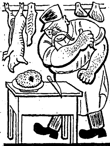
Má švába na mozku