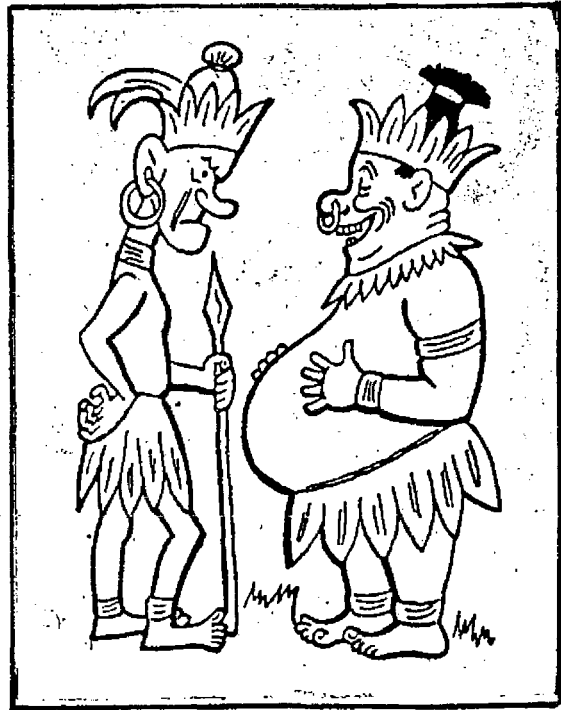
Má ho v žaludku