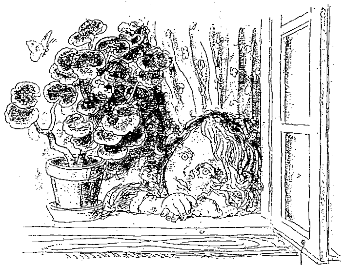
Josef Václav Sládek S L U N Í Č K O