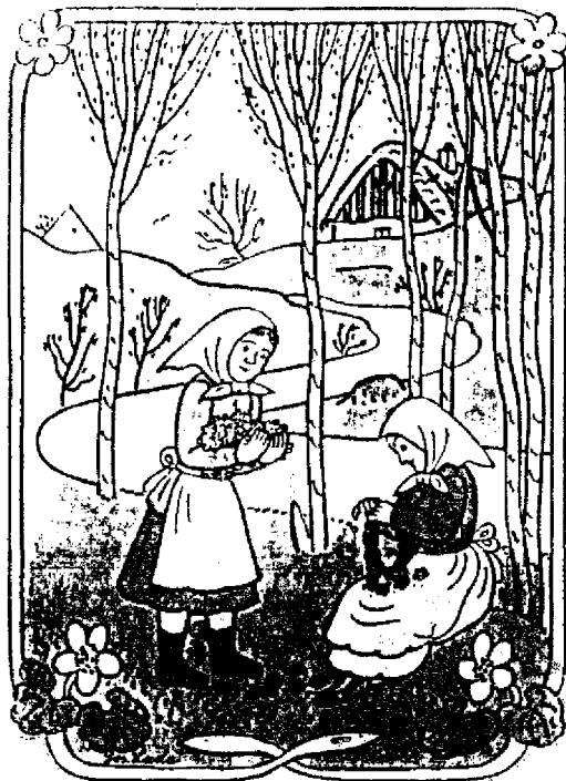
Josef Václav Sládek: V jarní den

Den svitnul krásný, slunečný po široširém kraji a jeho černým úsměvem se květy otvírají.