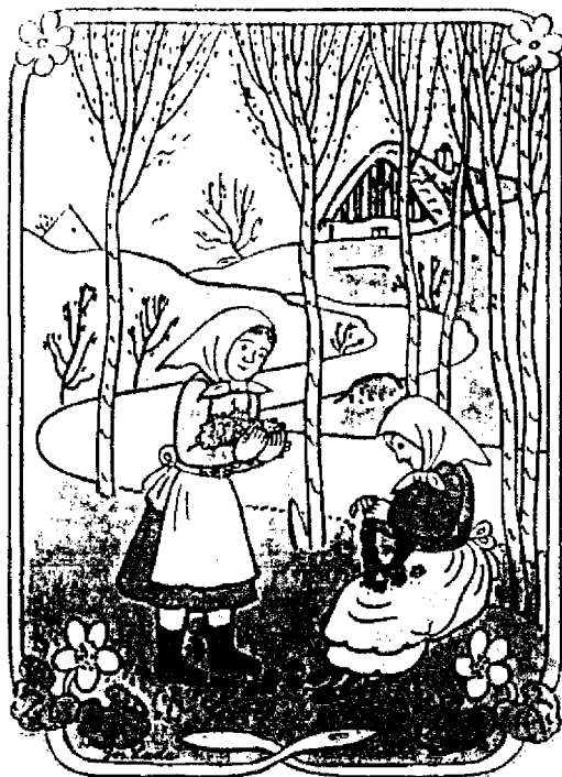
Josef Václav Sládek: V jarní den

Den svitnul krásný, slunečný po široširém kraji a jeho černým úsměvem se květy otvírají.