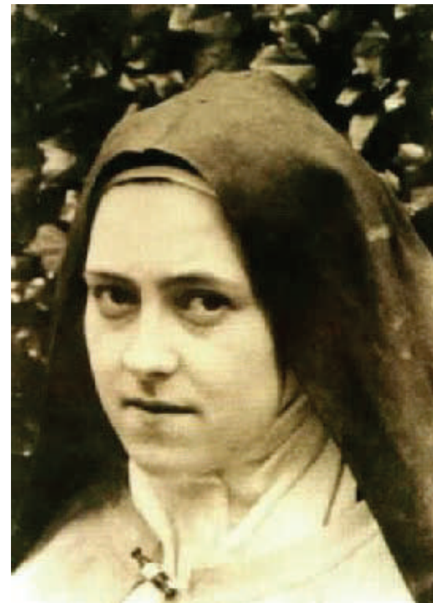
Sv. Terezie od Dítěte Ježíše

Podporujte podnikatele, kteří inzerují v našem Věstníku. Kupujte jejich výrobky a použijte jejich služby! Oni podporují naši misii svými inzeráty a dary.