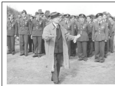
Prezident Beneš na návštěvě u čs. 310.perutě

Kdykoliv se v souvislosti s letošním sedmdesátým výročím Bitvy o Británii hovoří o účasti českých a slovenských vojáků a letců na spojeneckém vítězství nad fašistickým Německem, stočí se dříve či později diskuse na roli prezidenta Beneše. A když se začnou probírat jeho kroky a stanoviska – třeba jen od Mnichovské dohody do konce války a Košického vládního programu, a tedy s vynecháním února 1948 – dochází ještě i dnes mezi jeho příznivci a apolety na jedné a odpůrci a odsuzovateli na druhé straně občas ke sporům. Téměř tak, jak tomu bylo po celých těch sedmdesát let, i když s odchodem jeho generace se mnohé spory uklidnily. Vojáci a letci, pro které byl dr. Eduard Beneš symbolem a ztělesněním jejich hrdinného ozbrojeného boje se zbraní v ruce, na něho nedali nikdy dopustit a omlouvali jej i po Únoru, mnozí politikové tehdejší i pozdější doby jej zas přímo nenáviděli a to už nehovořím o komunistech. Dnes jej historici posuzují střízlivěji a bez onoho často těžko ukrývaného nepřátelství.