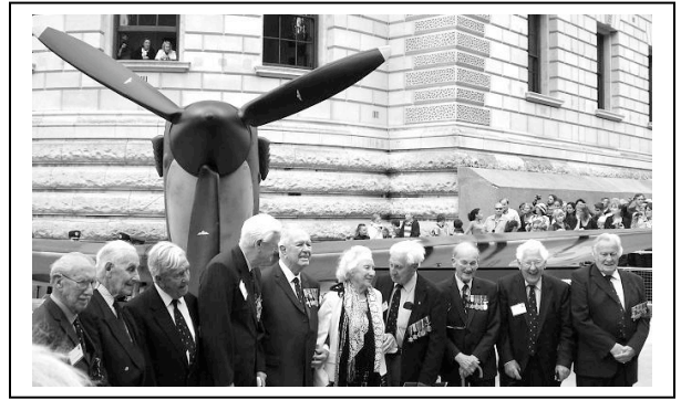
Veteráni BoB s Verou Lynn před kopií slavného Spitfire

20.srpna se v Londýně, před budovou ukrývající tajný Churchillův válečný bunkr, odkud premiér řídil vojenské operace, konala slavnostní vzpomínka na jeho slavnou parlamentní řeč o nutnosti vytrvat v zuřící Bitvě o Británii až do vítězství. Jde o řeč, kterou Britové zkráceně nazývají „The few“, neboť Churchill tehdy mezi jiným o „úsilí britských a spojeneckých“ stíhacích pilotů -- a tedy i Poláků a našich -- doslova prohlásil: „Ještě nikdy ve sféře konfliktů lidstva nebylo takové množství dlužno takové hrstce...“ Během vzpomínky, které se zúčastnila skupina