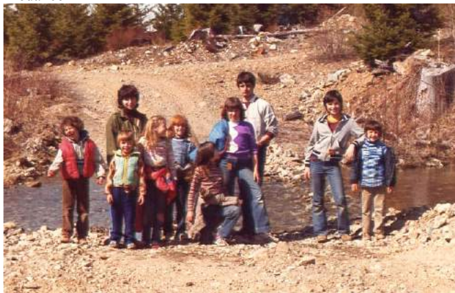
Tato fotka je z 1. Vítání Jara na Ostrově před 20-ti lety (1982) na Weeks Lake. Poznáte tam některé z našich a vašich "děti"?