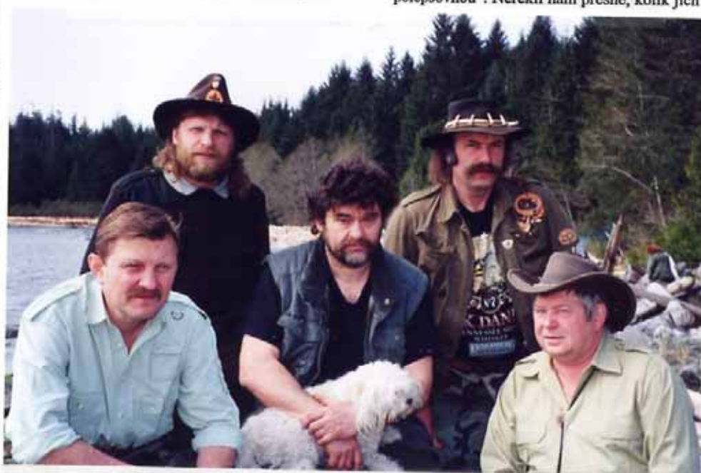
Na přípravách potlachu se podílelo mnoho trampů z Vancouveru, Calgary, Edmontonu i Ostrova. O koordinaci se starala "potlachová pěťka" - Fony, Bobin, Lampa, Saper a Satan

potlachové místo na Squamish River je malé a musíme se poohlédnout po něčem prostornějším. Na jaře 1997 jsme jeli téměř najisto na místo u Sorenta, které nám bylo doporučeno Lopatikem. Nejvíce nám na tom imponovala skutečnost, že se jednalo o soukromý pozemek a tím pádem bychom měli vyřešen problém s invazí zvědavých mastňáků z Vancouveru a odjinud. Poloha a vůbec celé místo se ukázalo být naprosto nepoužitelné a nám vyskočil na čele hluboké vrásky a otazník nad místem konání 5. Celosvětového potlachu se hrozivě zvětšil. Bylo nám jasné, že musíme