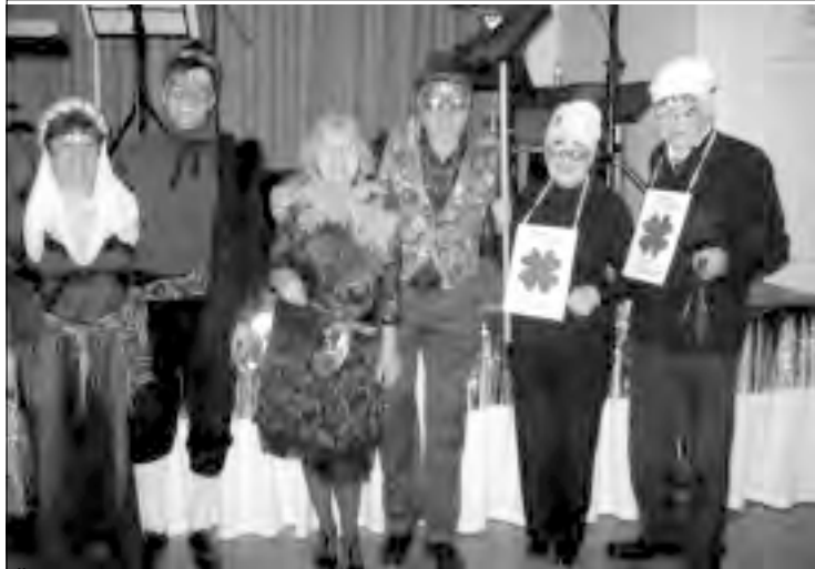
ŠIBŘINKY - VÍTEZNÉ MASKY