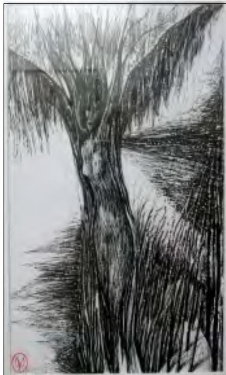
V. KRYKORKOVÁ: SKRYTÝ ANĐĚL

Wilsonovou v Praze v roce 2005 pod záštitou tehdejšího ministra kultury Pavla Dostála Art Canada Five. V minulosti již obě výtvarnice spolu v této galerii v Liberty Village vystavovaly.