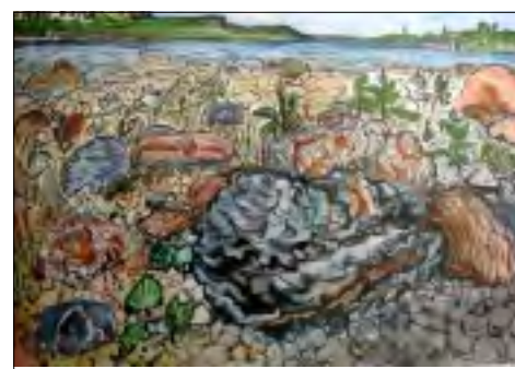
ROCKY SHORE IN GEORGIAN BLUFF