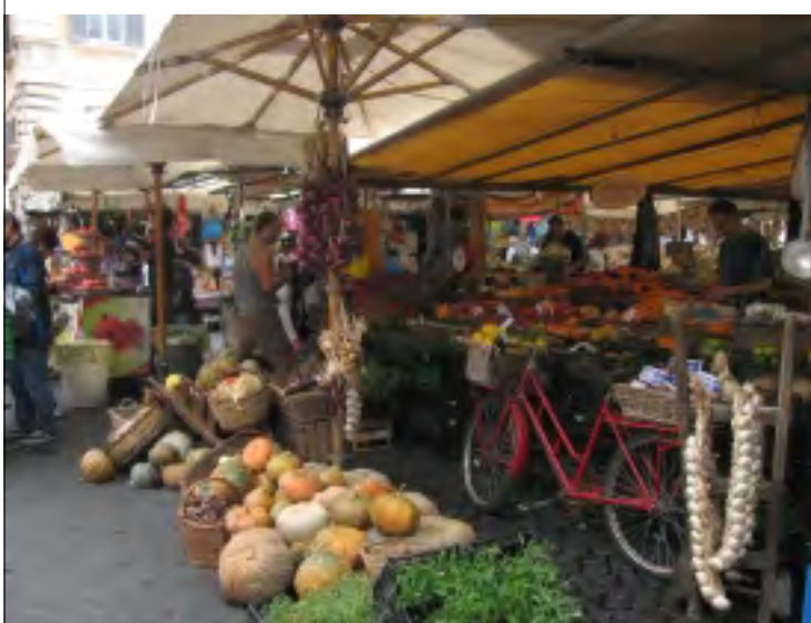
JEDNO Z ŘÍMSKÝCH TRŽIŠŤ

Musím říci, že to bylo neuvěřitelné setkání. Ale abych nepředbíhal. Přijeli jsme do Říma a bez problémů jsem vybral na letišti 200 eur z bankomatu. Když jsme, ale přišli na Velehrad, tak nikdo Travel Cheques neznal, v bance je nechtěli a ve směnárně na ulici chtěli téměř deset procent poplatků.