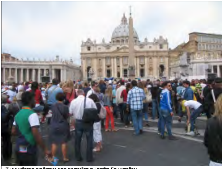
TAM NĚKDE VPŘEDU LZE VYTUŠIT PAPEŽE FRANTIŠKA

Vlastně to všechno začalo už hrozně dávno. Jak praví klasik, lépe řečeno klasička české literatury Božena Němcová: Dávno již tomu..., co létaly ČSA do Kanady, přesněji řečeno do Toronta a Montrealu a z té doby nám zůstaly karty ČSA Air Miles a zároveň i nějaké ty míle. Jenže nic netrvá věčně a jednoho dne vloni v září, přišel přes e-mail vzkaz, že musíme své míle zužitkovat do konce měsíce, jinak, že propadnou. Na cestu přes Atlantik jich bylo málo, ba ani do Irska, či Španělska jich nebylo dost. Zapřemýšleli jsme a zatoužili jsme po krásné dovolené u moře. „Taková Jugoška, pravil jsem zasněně!“ A již jsem se díval, jestli ČSA létají do Černé Hory. Nelétaly. V seznamu jmen jsem objevil dvě pohádková města Split a Dubrovnik a to na červen 2013. Pro jistotu jsem ještě připojil třetí možnost: Řím - květen téhož roku. A pak se nic nedělo.