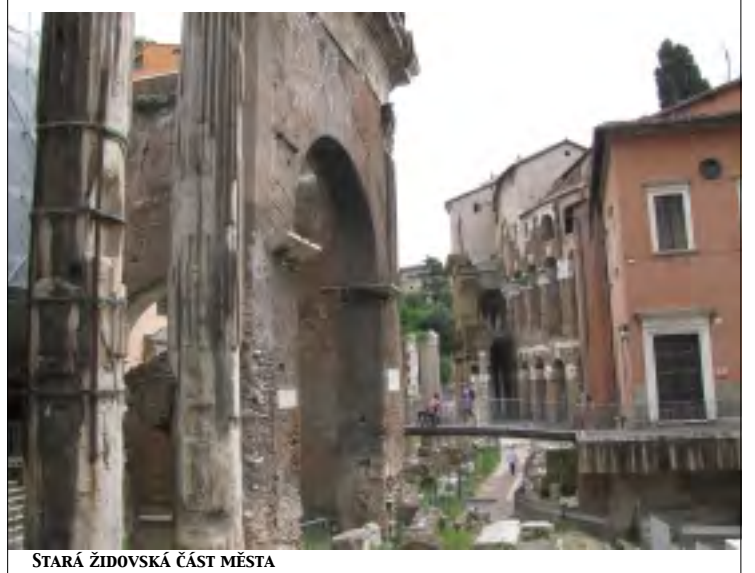
STARÁ ŽIDOVSKÁ ČÁST MĚSTA

Jak již jsem řekl, vidět nového papeže je velmi obtížné, poutníci na něj čekají od šesti hodin ráno a náměstí před katedrálou je zcela zaplněné. Za to dostat se do Sixtinské kaple nezabere ani deset minut. Pravda musíte absolvovat řadu sbírek z Vatikánského muzea a kromě Rafaelových fresek můžete vidět i pěknou výstavu moderního umění. Tam všude již to vzdali a můžete fotografovat, jen v sixtinské kapli, kde se pravidelně ozývají výkřiky