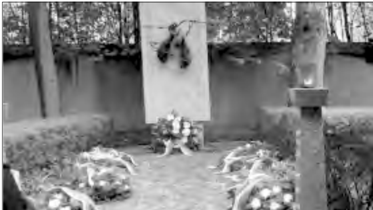
Děkuji všem dávatelům