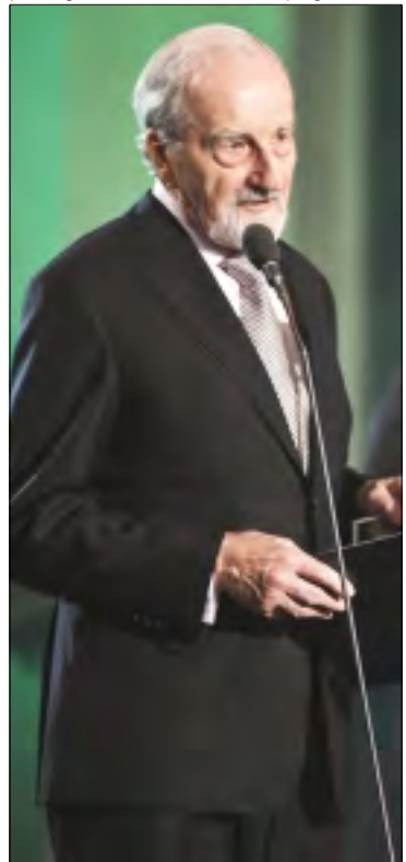
VÁCLAV TÁBORSKÝ V PLZNI