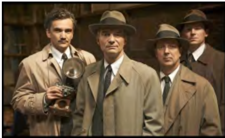
DAVD ONDŘÍČEK: VE STÍNU