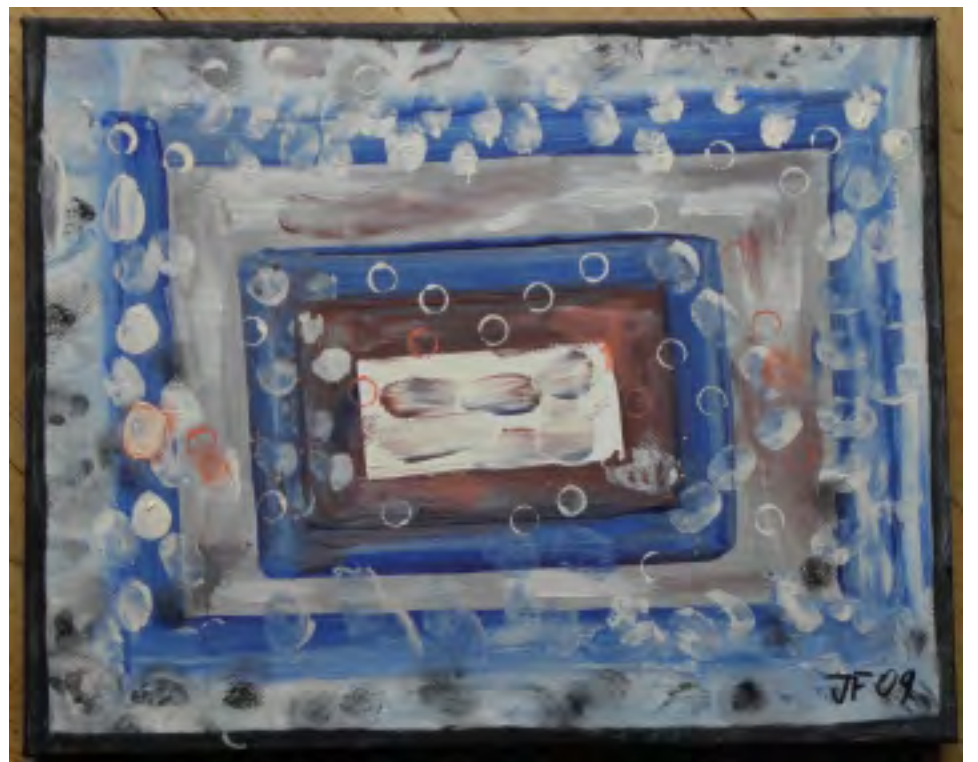
JANA FAFEJŤOVÁ: ZIMA V SUCHDOLE - 2009