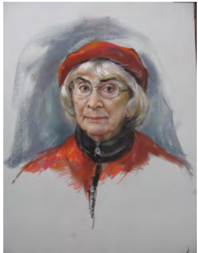
Mother - Pastel