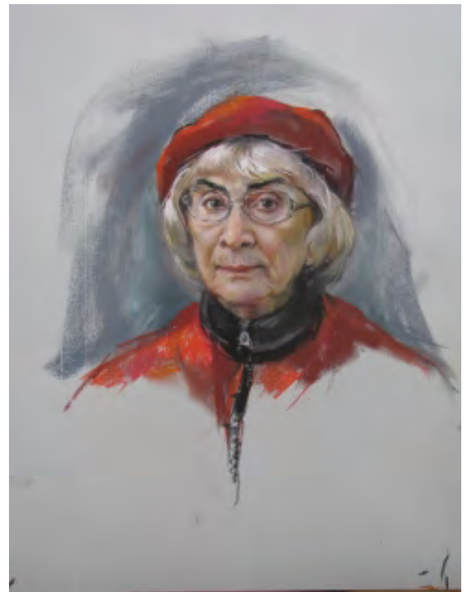
Mother - Pastel