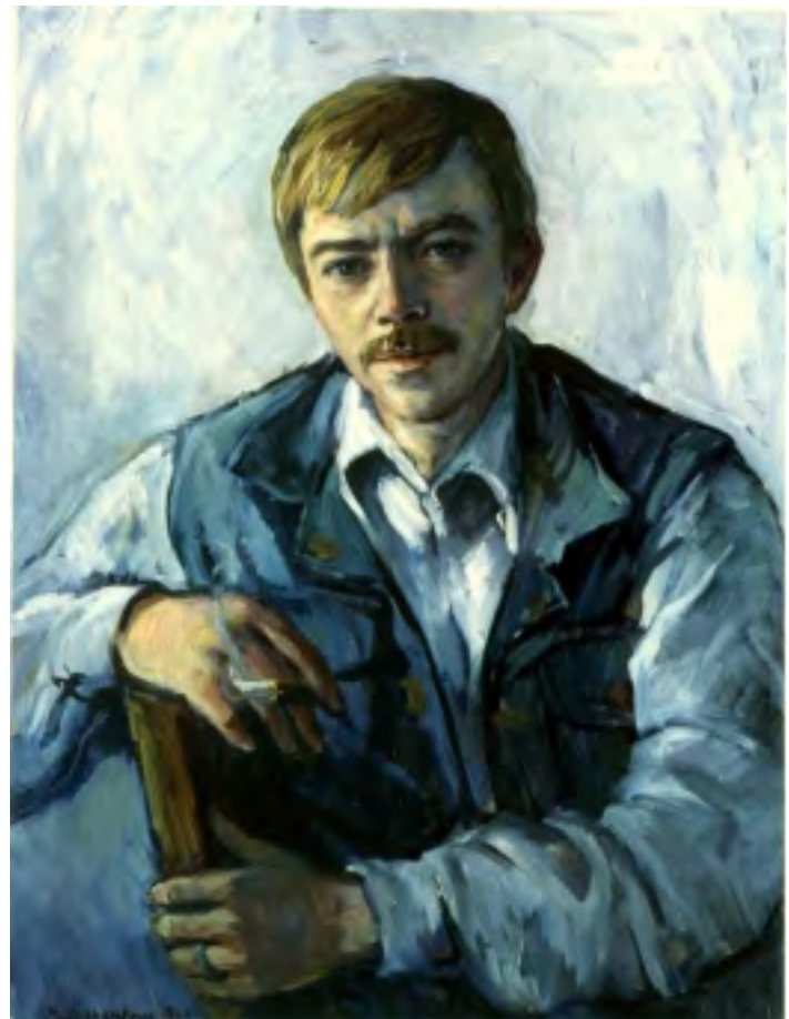
Portrét Karla Kryla