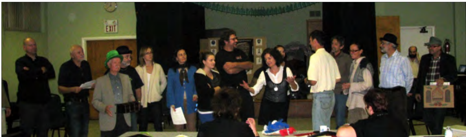
POHLED NA ZKOUŠKU V HALE KOSTELA SV. PAVLA DNE 2. 10. 2012