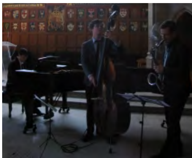
SAXOFÓNOVÉ SÓLO PRO J. ŠKVORECKÉHO

A to ještě 28. října v 10:45 hodin je oslava 70. výročí založení slovenského evangelického kostela svatého Pavla na 1424 Davenport Rd. Po slavnostních bohoslužbách bude v 13 hodin banket.