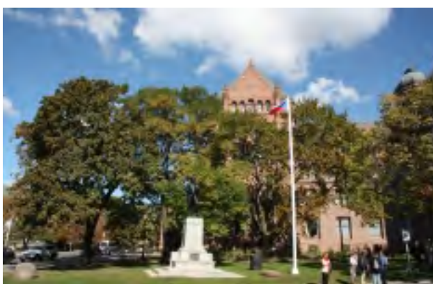
ČESKÁ VLAJKA PŘED ONT. PARLAMENTEM

Po chvíli položil sobě i nám otázku: „Co je dnes za den?“ Odpověděl jsem, že středa. Tato odpověď ho přímo vytočila: „Nedělejte ze sebe blbýho!“ vzplanul spravedlivým hněvem a pak dodal: „Tak já vám to povím! Dnes je 28. října a vy jste zde demonstrovali!“ Vůbec jsme si neuvědomili, že je nějaké výročí a snažili jsem se zapochybovat o logice jeho argumentu: „Kdybychom demonstrovali, tak bychom šli aspoň někam, kde by nás bylo vidět!“