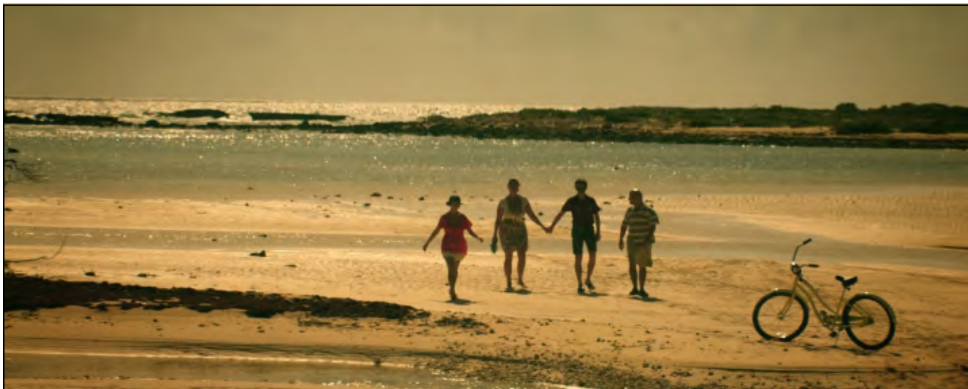
Z FILMU SVATÁ ČTVEŘICE

Ve čtvrtek 6. září 2012 začne letošní Torontský mezinárodní filmový festival (TIFF). Letos diváci uvidí 372 filmů, z toho 289 celovečerních, čili o 35 více než vloni. 93 procent při tom bude mít svoji premiéru. O festival byl letos rekordní zájem a přihlásilo se 4143 účastníků, z toho 952 bylo z Kanady. Zúčastní se 72 zemí oproti 65 v roce 2011. Bude se promítat na 34 stříbrných plátnech či obřích obrazovkách a celková délka promítaného materiálu je 30 918 minut, což odpovídá více než 515 hodinám. Nejdelsí bude čtyřapůlhodinový japonský film Penance (Pokání) od Kioši Kurosawy, původně udělaný jako televizní seriál. Nejkratší trvá sto vteřin a jmenuje se Slunce nad Pacifikem .